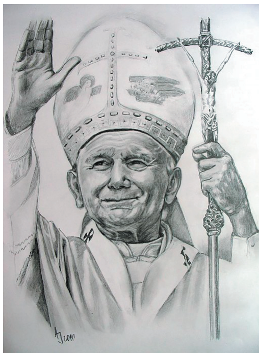
Ján Pavol II. bol veľkým ctiteľom Panny Márie

„Taká jednoduchá, no taká bohatá modlitba si zasluhuje, aby ju kresťanské spoločenstvo znovu objavilo. S dôverou vezmeme do rúk ruženec. Objavme ho vo svetle Písma, v súlade s liturgiou a v kontexte vášho každodenného života. Nech táto moja výzva neostane nevypočutá! Vrucna prosba ku Kráľovnej posvätného ruženca: „Ó, Máriin posvätný ruženec, sladká reťaz, ktorá nás spája s Bohom, puto lásky, ktoré nás spája s anjelmi, veža spásy pred útokmi pekla, bezpečný prístav pri našom strokotaní, nikdy ťa neopustíme. Budeš našou posilou v hodine smrti. Tebe bude patriť náš posledný bozk života, ktorý zhasína. A posledným výdychom našich pier bude tvoje sladké meno, ó, Kráľovná pompejského ruženca, ó, naša najdrahšia Matka, ó, Útočisko hriešnikov, ó, najväčšia Útecha trpiacich. Nech si všade požehnaná, dnes a naveky, na zemi i v nebi.“